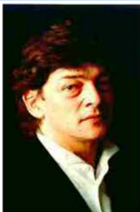
Articoli correlati: •Una serata con Ravel

Fabio Calderola fabio.calderola@voceditalia.it