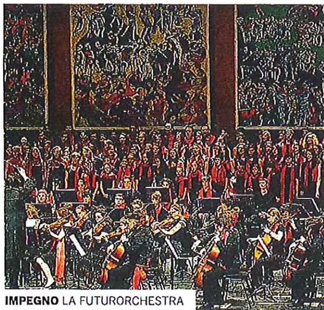
IMPEGNO LA FUTURORCHESTRA